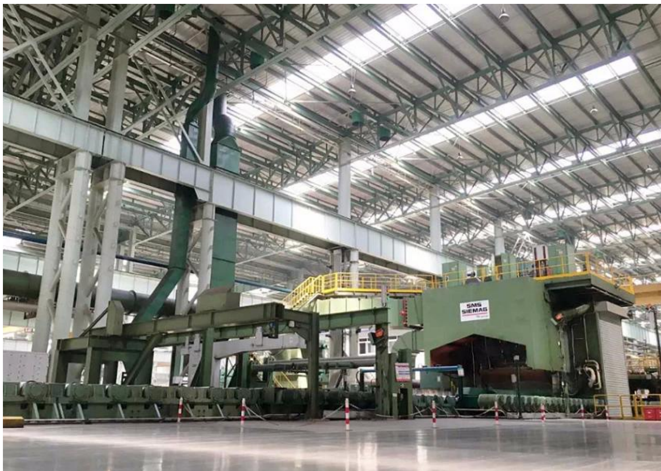
Equipamento de processamento